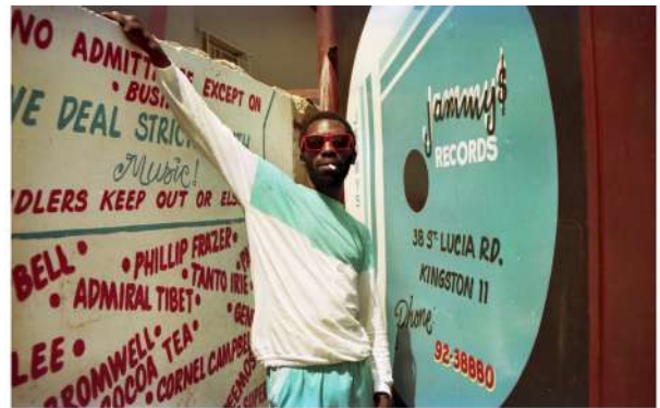
Jammy Studio