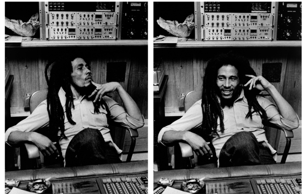
Bob Marley