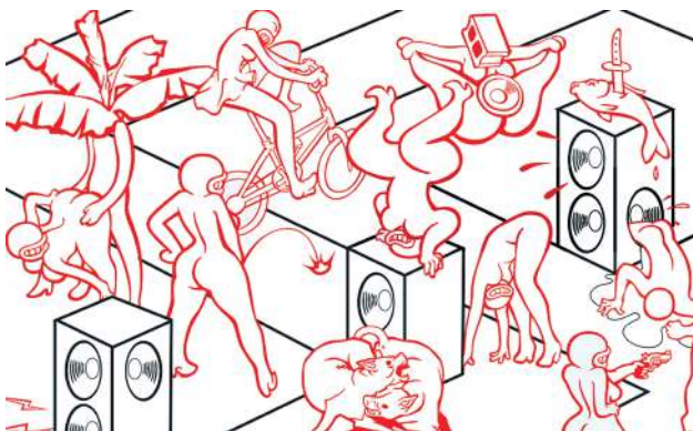
Back-a-Road, 2017, Leasho Johnson