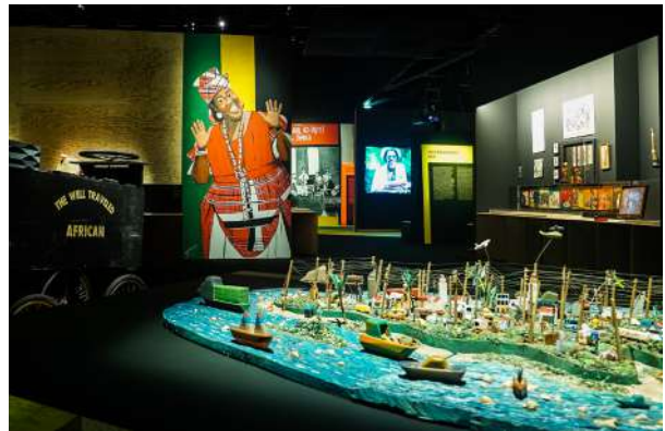
Vue de l'exposition, au fond les peintures de Danny Coxson