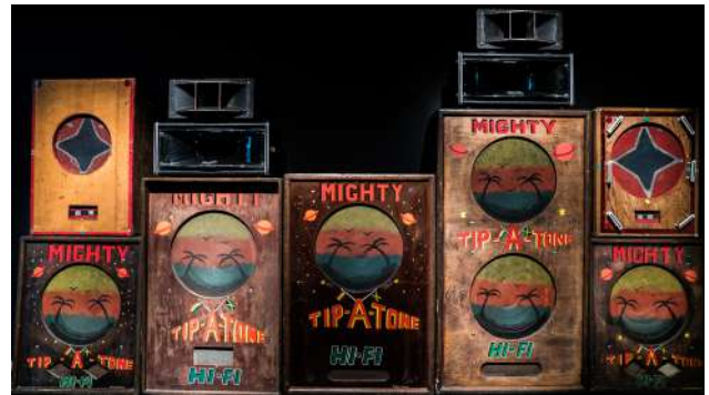
Ensemble de Sound Systems, Lick it back Collection