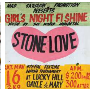
Serious things a go happen, ensemble de panneaux Dancehalls jamaïcains